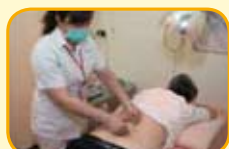
將電極夾至於針身近針柄或針柄處