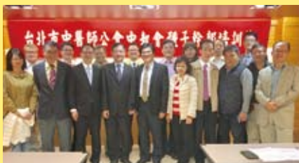
舉辦中執會健保業務種子幹部研習會