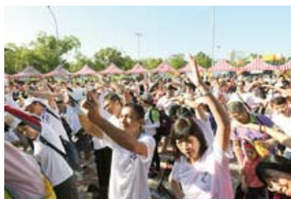
參加人士熱烈參與大會操