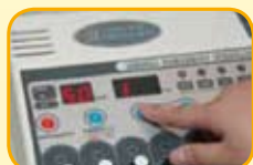
振幅強度由歸零開始調大，勿使患者不適並設定好時間