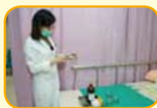
將點燃的酒精棉棒放入玻璃杯中後迅速取出