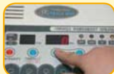
時間到時先將振幅調整至零，再關電源