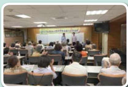
民眾參加中醫健康講座