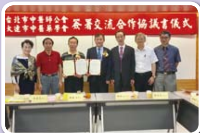
本會與大連市中醫藥學會簽署MOU