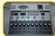
確認電針機按鍵歸零後，打開電針機開關