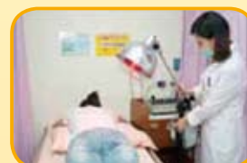
應每隔5 分鐘看巡 1 次