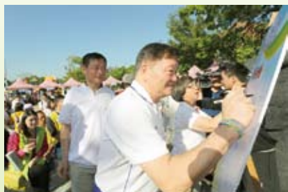
體育局鄭局長簽署健康宣言