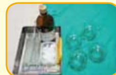
準備乾淨玻璃杯，酒精棉棒點火