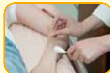
照前述進針方式入針