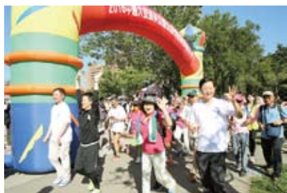
理事長引領參會者慢跑