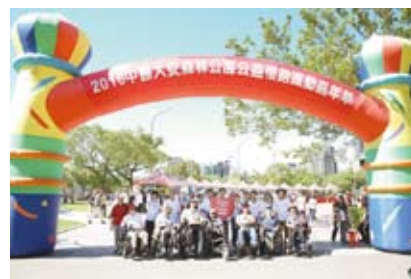
脊椎損傷病友參與活動