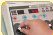
調整治療所需頻率