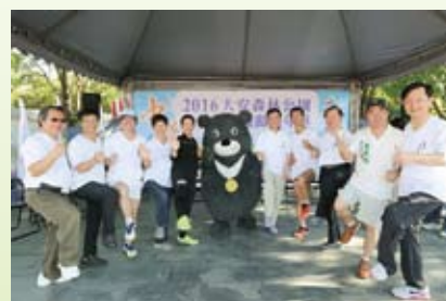
貴賓和世大運吉祥物熊贊合影