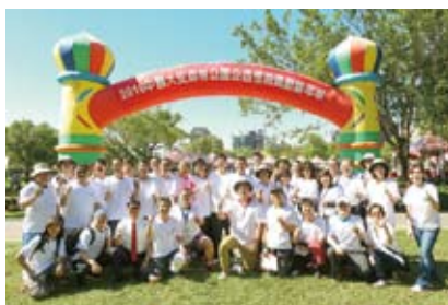
公會理監事幹部及貴賓合影