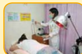
打開紅外線並設定好時間