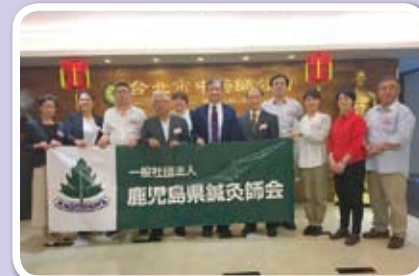
日本鹿兒島針灸師會參訪公會