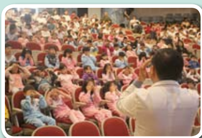
中醫穴位護眼操校園推廣活動