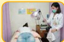
距離穴道部位30-45公分，略見紅光；避免造成燙傷