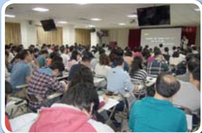
台灣經方名家講座