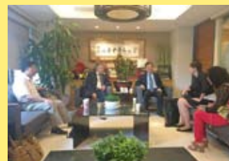
俄羅斯針灸學會副會長拜訪公會