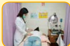
協助患者擺成適當體位