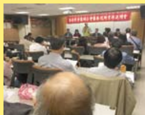
舉辦院所業務法規座談會