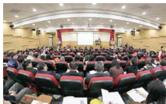
2013年國醫節楊維傑教授演講座無虛席